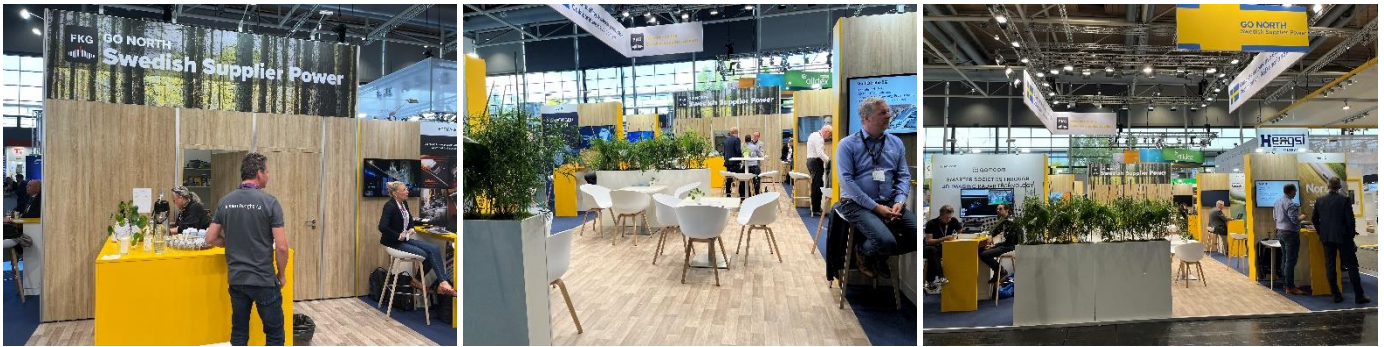
FKGs samlingsmonter IAA 2022, referensbild för stil av monterbyggnationen på IAA Transportation 2024