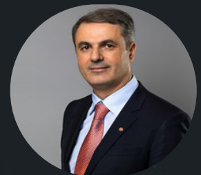
Ibrahim Baylan Näringsminister