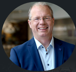
Martin Lundstedt CEO Volvo Group